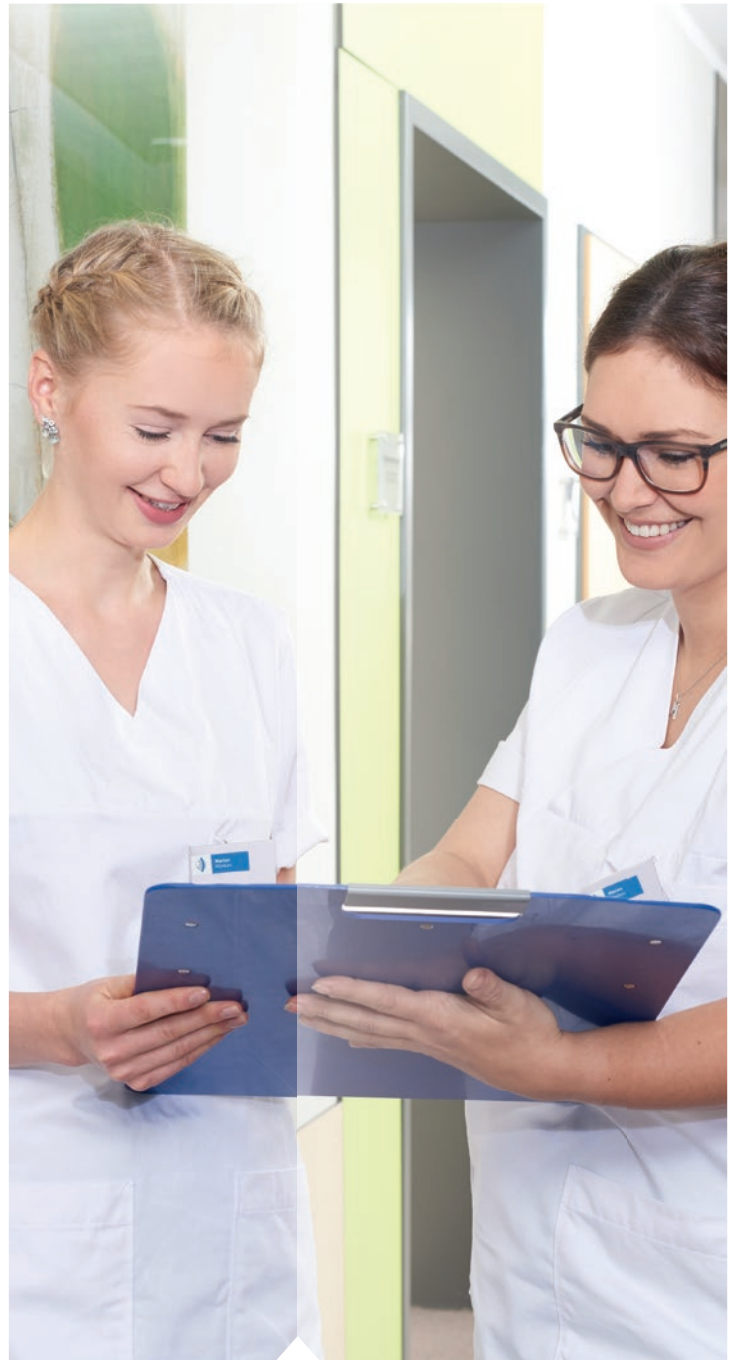
Berücksichtigung der Menschen in ihrer Vielfalt

Zur Wahrung der Wirtschaftlichkeit gehen wir mit den uns zur Verfügung stehenden Mitteln sachgerecht, verantwortungs- und umweltbewusst um. Wir haben Achtung vor der Schöpfung und helfen diese zu bewahren.